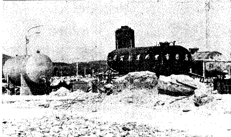
上：行政院長孫運璿到嘉義縣巡視基層建設。