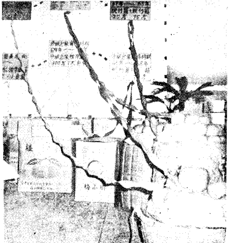
我國農產品包裝，由竹篾（右下角）演變到紙箱分級包裝，進軍國際市場。（中央社）

行政院指出，為節約能源，並符合便民政策的要求，今年以提早上下班時間，來取代「日光節約時間」。各機關、學校每天上班上學時間是上午 8 時至 12 時，下午 1 時至 5 時。如確因情況特殊，得視實際需要，由各主管機關核准，調整作息時間。