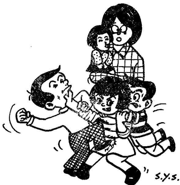
家庭孩子多父母煩惱多 (英欣)

現在我的大孩子已在國小讀書，老二上幼稚園，無牽無掛，我們夫妻可安心工作，小孩都能得到應有的照顧，家庭也能略有儲蓄，一家幸福樂融融！”