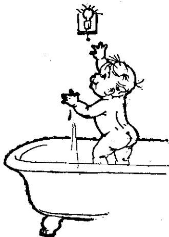
小孩手潮濕不可摸開關

細心注意、設計，就可以防範許多不必要發生的災害和意外，這樣，財物及精神上亦可避免無謂的損失，所以雖是“老生常談”，但不可不重視。