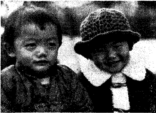
實施家庭計畫出生的孩子最幸福 (黃暉超)