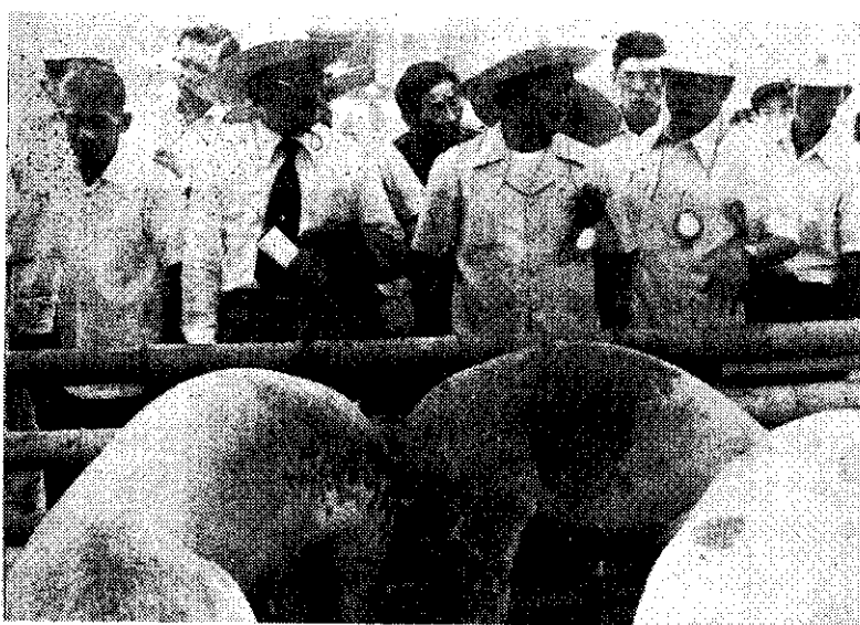
上：經濟部次長張訓舜視察農業機械試驗及示範。