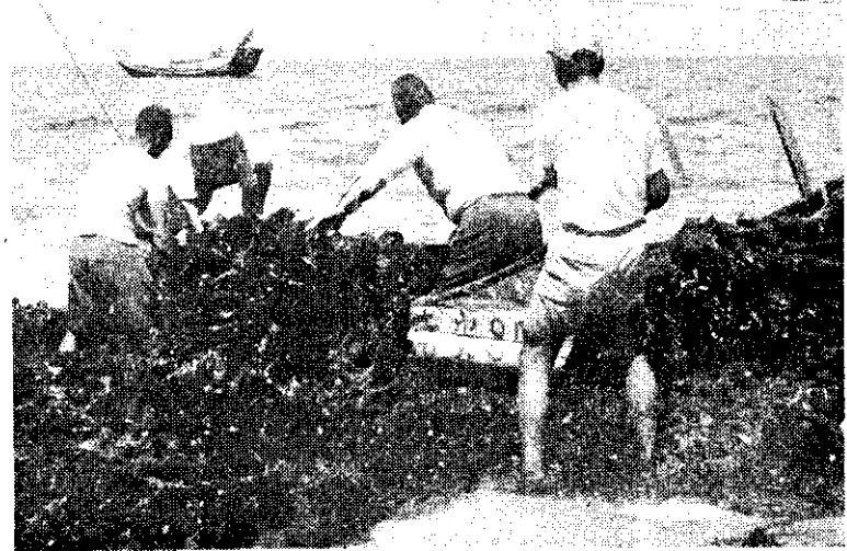
上：省府主席林洋港巡視花蓮基層建設。