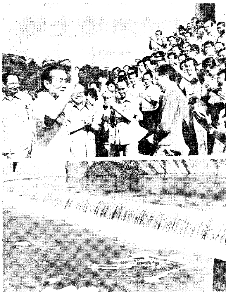
上：行政院長孫運璿向參加自強愛國座談會人員揮手致意。

此外，農發會還將積極輔導43個農會更新現有超齡使用且加工能力及碾率極低的粳谷機械，以提高