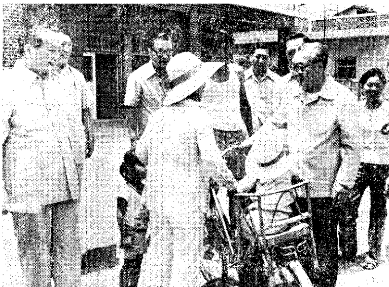
蔣總統巡視宜蘭縣地方基層建設。