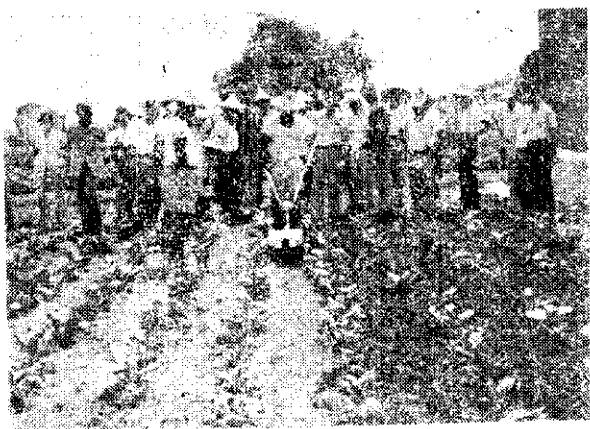
板橋市農會舉辦小型中耕除草機示範觀摩(黃兆鴻)

據農會表示，小型中耕除草機作業試驗結果，每公頃約可節省40個工作天，且機械構造簡單輕便，容易操作，適於葱、大芥藍、甘藍等使用，值得推廣。(黃兆鴻)