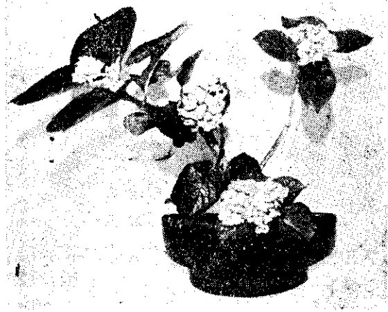
圖2：紫陽花以花色，花姿取勝，儘量使其表現花姿使生動可人。