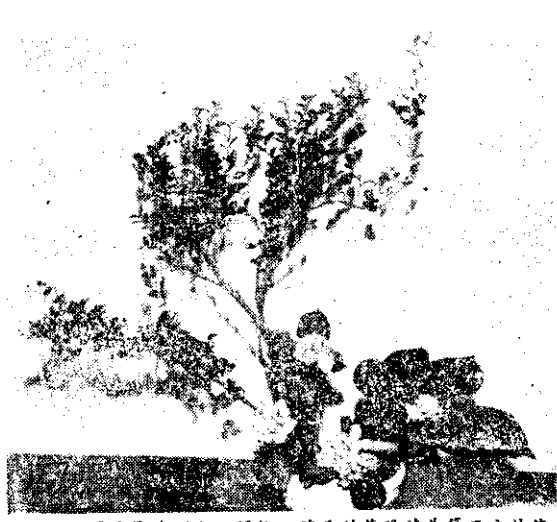
圖4：葉片豐腴可人，開粉紅花朵的紫陽花為第三主枝使其顏面朝上，似與第一主枝喁喁細訴。