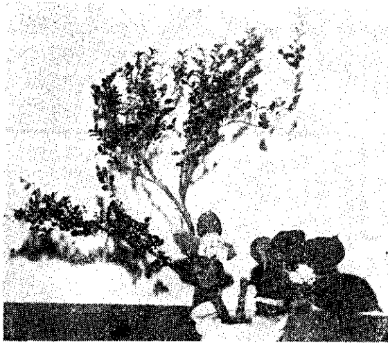
圖5：另置一枝剪短的紫陽花於第三主枝左側，依於第一主枝前方。