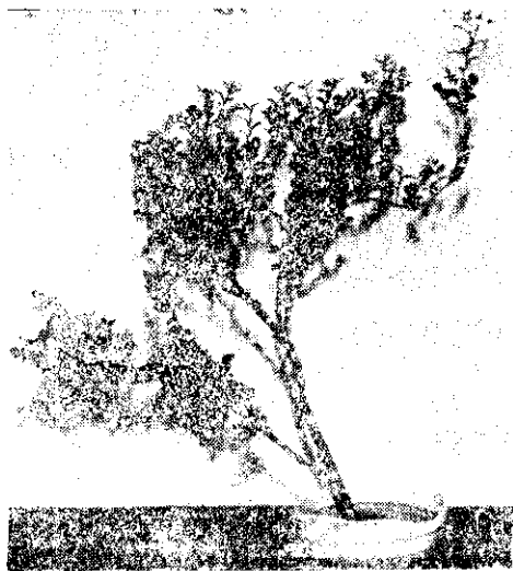
圖3：以另一枝稍短小的黃楊為第二主枝，斜倚於第一主枝的左前方。