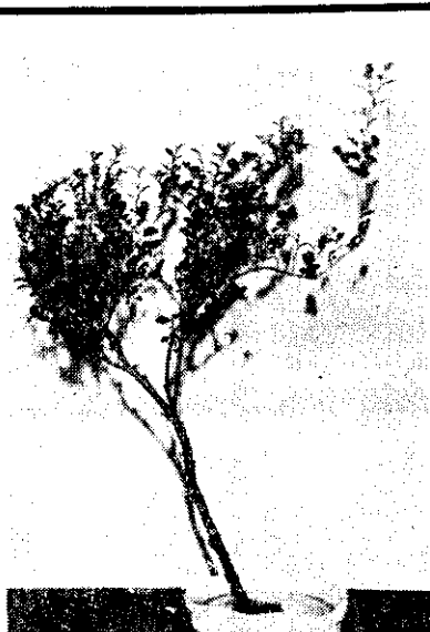
圖2：選一秀挺黃楊為第一主枝，使彎度向右。