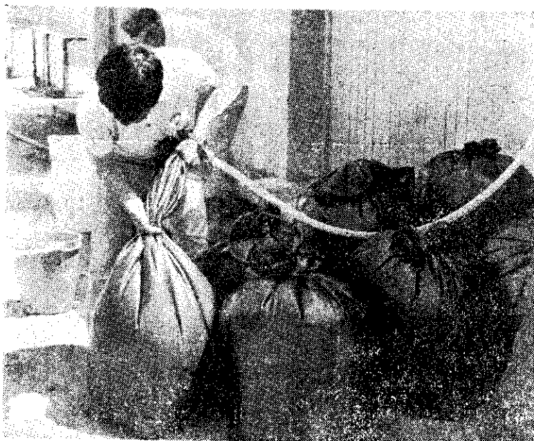
活魚輸送前充灌氧氣

目前從事活魚輸送業的主要有3家，此外還有7、8家零星從事，每天都有活魚運銷台北和香港。輸出價格以鱧仔最低，至台北者每公斤130~150元，至香港者每公斤380~420元。鯇至台北者每公斤150~160元，至香港者每公斤270~280元。以老鼠斑最貴，輸至香港，每公斤高達1,500~1,700元。鑲點石斑銷至台北者，每公斤270