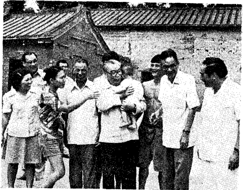
蔣總統經國巡視桃園農村，垂詢農家生活情形。

農發會表示，政府為了減輕農民的負擔和農業的生產成本，規定從民國65年度起，以灌溉為目的的抽水機和稻谷烘乾機，其用電量可按台電公司的成本價格付費，由政府補貼用電售價與成本間的差額。上述抽水機和烘乾機停用期間的基本電費，也由政府代付。