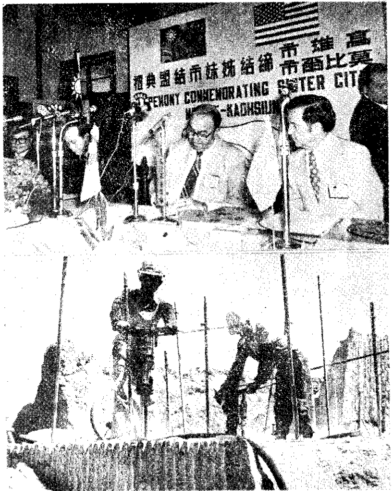
上：高雄市與美國莫比爾市締結為姊妹市。

韓國選舉人團「統一主體國民會議」8月27日正式選舉現年49歲的全斗煥為總統，使這位前陸軍將