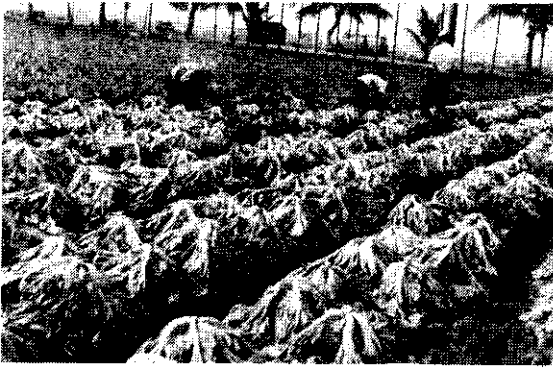
曝曬芥菜，以供醃製酸菜