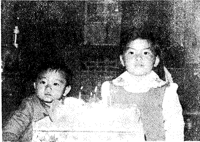
我兒我女，活潑健康，聰明可愛