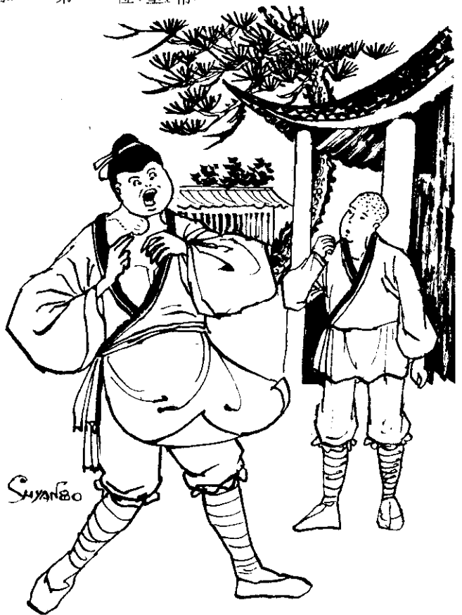
只要師兄心存陰謀陷害朱元璋時，頸間的大瘤就會痛得不能忍受。

朱元璋在皇覺寺中待了一段時間，總覺不是長久之計，於是他向師父說明了心意，想要遠去開創一番事業。師父不但加阻攔反而給予他莫大的鼓勵。朱元璋順利地離開了皇覺寺，憑著自己的才智再加上的機運，竟然成了明朝的第一位皇帝。