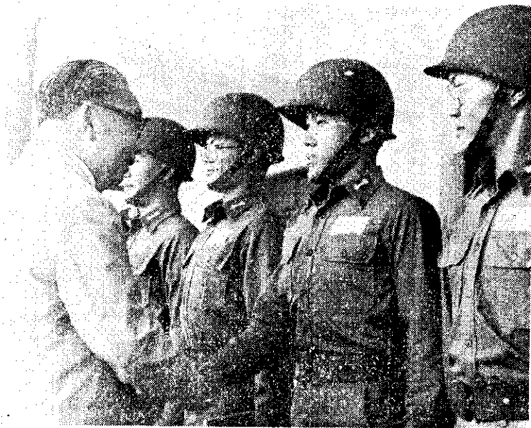
蔣總統經國頒發大專暑訓績優學生

已經編成海軍自強中隊的飛彈快艇，係由我國海軍參照目前世界上速度最快與性能最優的作戰快艇，並針對我國海軍作戰需要而設計的，由中國造船公司負責承造，是軍、公、民營國防科技合作的結晶，也使我國海軍從此步入以飛彈為主的戰備階段。