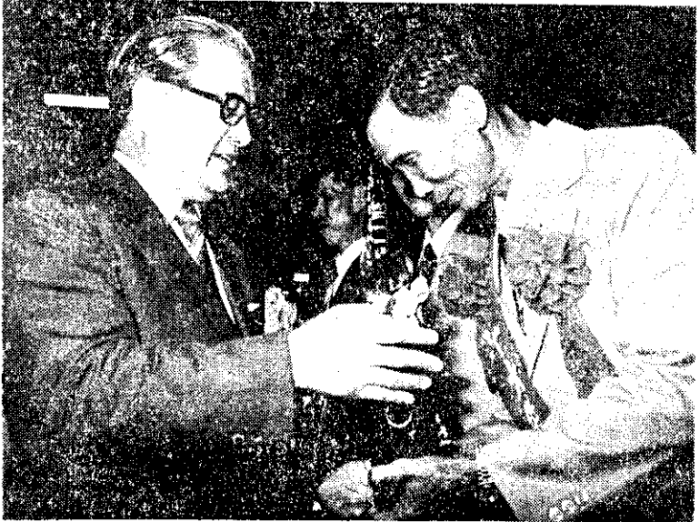
上：紀念孔子誕辰僑生朝聖暨賢達訓。