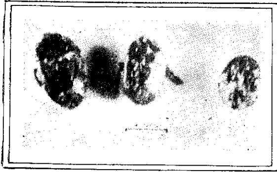
左邊2隻是成虫，右邊是若虫，可見翅芽——