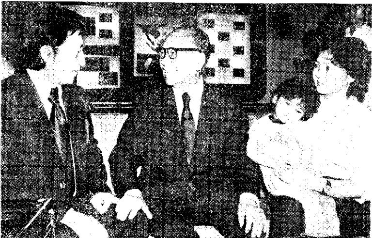
上：行政院長孫運璿夫婦設宴款待南非共和國總理波塔夫婦及隨員。