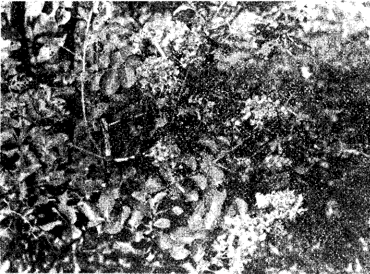
圖 3：九宮子特意把花兒一簇簇的安排在枝梢，嬌嫩的花在艷陽下顯得格外亮麗。它的葉子也在快樂的享受日光浴呢！