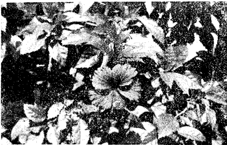
圖 4：扶桑的花，雖然欲語還羞的低垂粉頰，但仍不忘陽光對它的重要性。