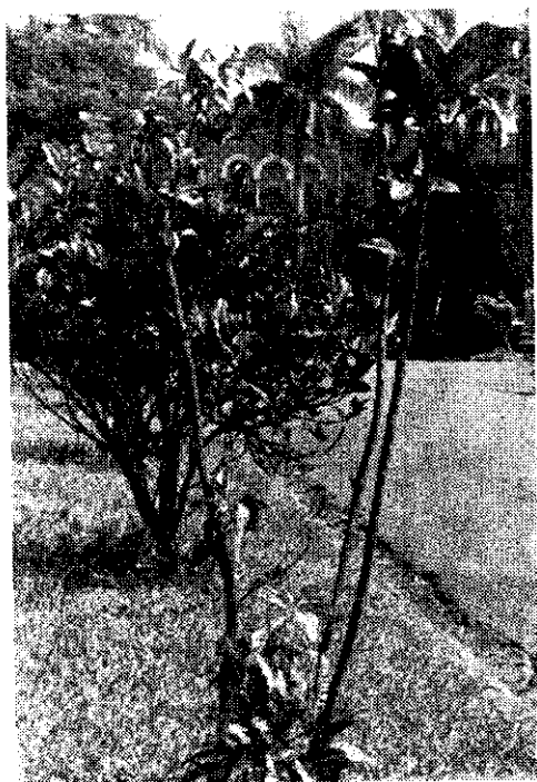
圖1：這株變葉木仰着長長的脖子迎向陽光