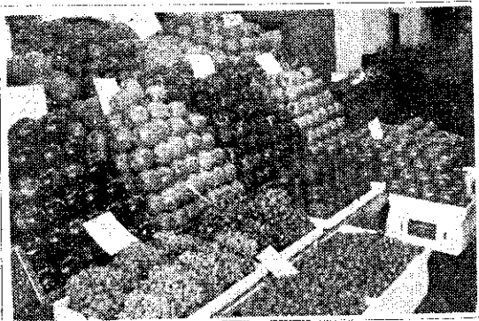
美國柑桔類零售情形

近3年來，全世界柑桔類每年的總生產量平均5,000萬公噸左右，而本省每年的總生產量30萬公噸左右，約占0.6%。