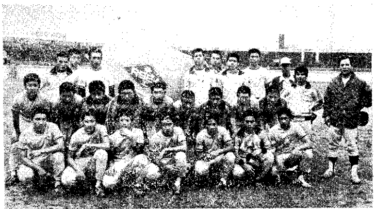
榮獲中華杯棒球賽北區初賽冠軍的榮工隊

農發會技正芮承榮表示，民國63年以前，農民繳交稻穀擁擠零亂而費時，爲了担心稻穀所含水份超過規定，往往把稻穀晒得過乾影響重量，同時個別繳谷也造成運輸工具與能源的浪費。現在這些困擾，已經解除，因爲自民國63年以來，各地農會已經按照當地的氣候和稻穀收割的情況排定日程，由農會派人到農家辦理稻穀驗收和運送工作。這種便民的服務，也使政府田賦征實、稻谷生產無息貸款與餘糧收購的政策得以順利實施。