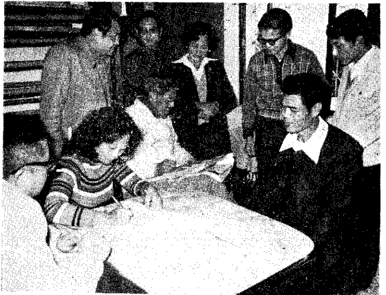
台北市長李登輝觀察農業普查情形

省政府表示，71年度雜糧生產目標決定為大豆8萬公噸，玉米20萬9千公噸，政府為鼓勵農民種植，決定以生產成本加上兩成利潤訂定保證收購價格，對農民無限制收購。