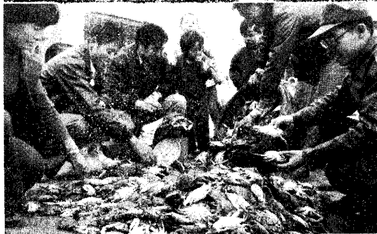
下：馬祖巧蟹成產季節，駐軍居民爭相購買。

或郵局存摺儲金及劃撥儲金的提款單繳納稅款。稅務局表示：為求符合政府便民利民政策，今年除擴大辦理納稅人郵遞申報外，另外增加上述3項新規定，使納稅人能獲得比往年較大的便利。