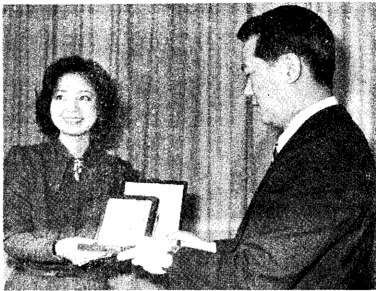
上：歌星鄧麗君接受行政院新聞局頒給愛國演藝人獎。

省稅務局表示：納稅義務人於繳納69年度個人綜合所得稅時，其申報方式可以財政部所規定的3種方法中任擇1種：(1)以現金繳納稅款，(2)以金融機構支票繳納稅款，(3)以金融機構活期存款的取款條，