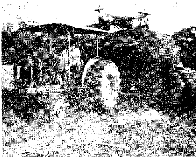
狼尾草收割後運搬

④種植：整地後可用選定的行距開淺溝；深度大約 10 公分，撒基肥於溝底，將有 2 節的草苗 1~3 枝，斜靠溝邊，然後覆土踏緊，苗頭稍露於土面以上。