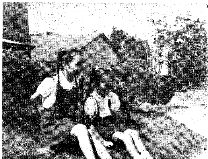
生女孩有什麼不好？看！這對姐妹花不是挺幸福的！（利玉芳）