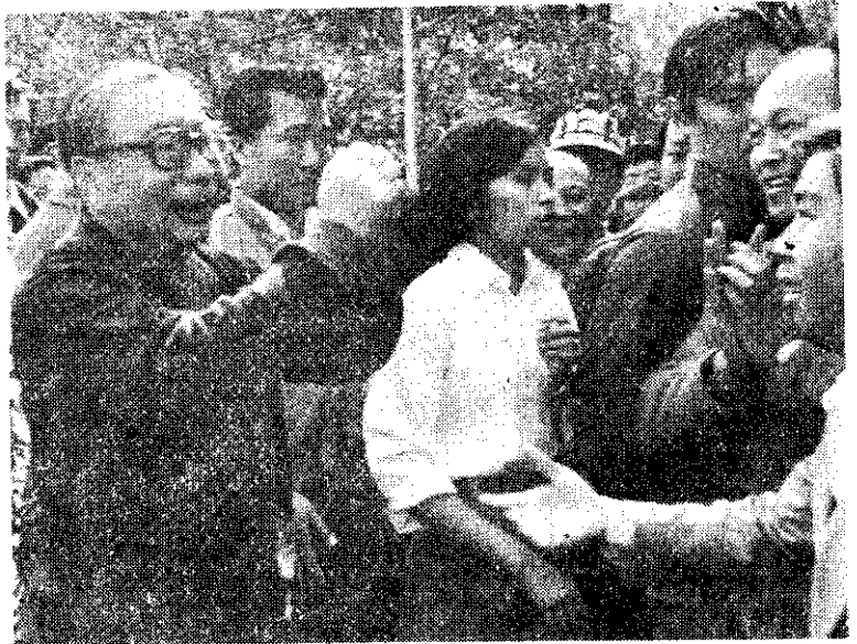
蔣總統經國到台南巡視地方建設，答謝民眾歡呼。

省農林廳表示，為確實了解本省農機現有數量，並配合新的農業機械管理辦法的實施，與中油公司全面換發購買卡等政策的推動，特辦理農機全面普查與登記，以期有效掌握農機推廣和分布情形，作為推動農業機械化政策的參考。同時利用電腦管理，以建立全國農機資料庫。