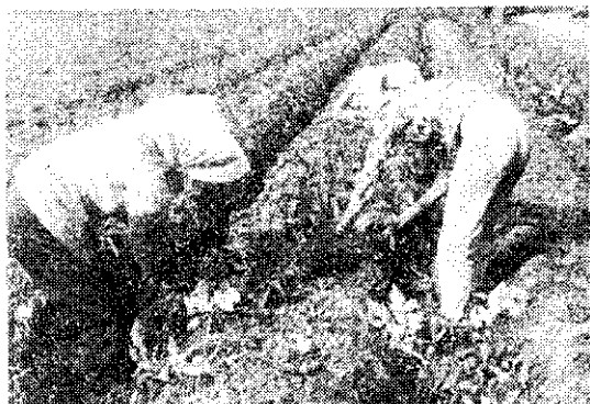
採收前先用人工刈除莖葉，放於畦溝，當作綠肥。

冷藏： 裝於木箱或竹籠內，在馬鈴薯用冷藏庫（空）中冷藏。冷藏室內忌密堆，宜留換氣線及通路，並掛乾濕溫度計或濕度計，每天查對室溫及相對濕度。食用薯的冷藏標準溫度是2~5°C，相對濕度85~90%。