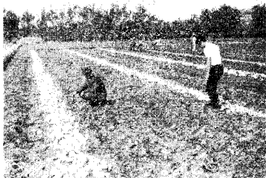
人工採收：讓表皮乾燥後才搬運，開始貯藏。此種方法是農友自行貯藏或作種薯貯藏的。