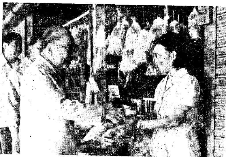
蔣總統經國巡視南投地方建設，詢問商店經營情形。

宗農產品則有上漲趨勢，所幸政府已將穩定物價作為今年重要經濟政策目標，全年物價上漲率訂在 9.5% 的水準，農產品價格將能維持相當程度的穩定。