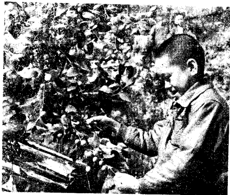
在農發會協助下，馬祖已成功培植了許多果樹。

農發會表示：凡年滿 20~28 歲，未婚，已在高中、高農、農專畢業，或在農專肄業，具有 3 年以上飼養乳牛或豬隻實際經驗，並曾參加基層農業推廣組織，表現優異的農村男女青年，可即日隨帶有關証