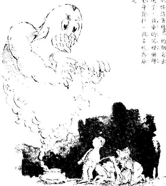
定 全 現 妖 身 驗 怪 發 打 萬 孩 擊 萬 童 的 綠 的 色 父 的 烟 母 姑 霧 嚇 嚇 出 得 得 現

老婦人生氣的把妖怪重又埋藏起來，從此以後，再也沒有人看到了那老婦人，那座茅屋也不見了，但是洞庭湖中的魚蝦等生物卻越來越多了！