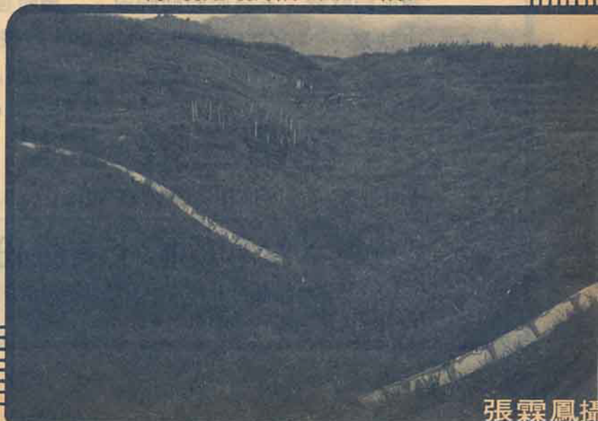
5. 沖蝕溝植草後可供排水，兩側田區利用預鑄洩槽引水入溝內。