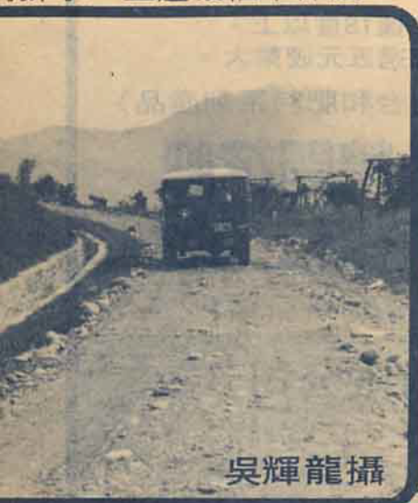
溝排水，上邊坡植草保護。