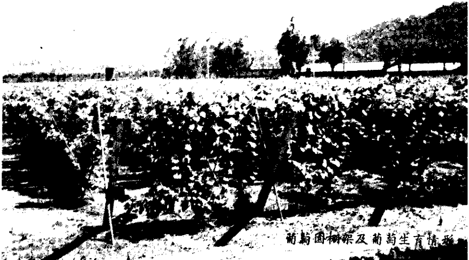
葡萄園樹架及葡萄生育情形