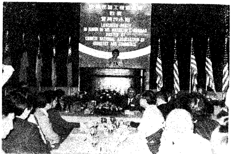
美國總統雷根長女，美國海外銷售協會總經理兼首席發言人學玲·雷根，6月12日在台北圓山飯店發表演說。

下屆縣市議員及鄉鎮縣轄市長選舉，定明(71)年1月16日舉行。本屆縣市議員及鄉鎮縣轄市長任期，均延長至明年3月1日屆滿。