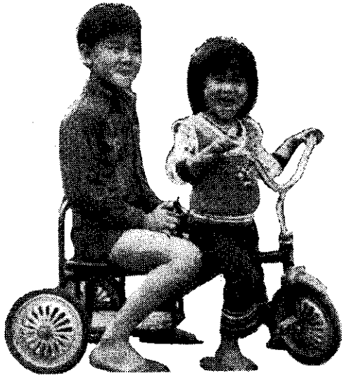
兩個孩子恰恰好 (王二郎)