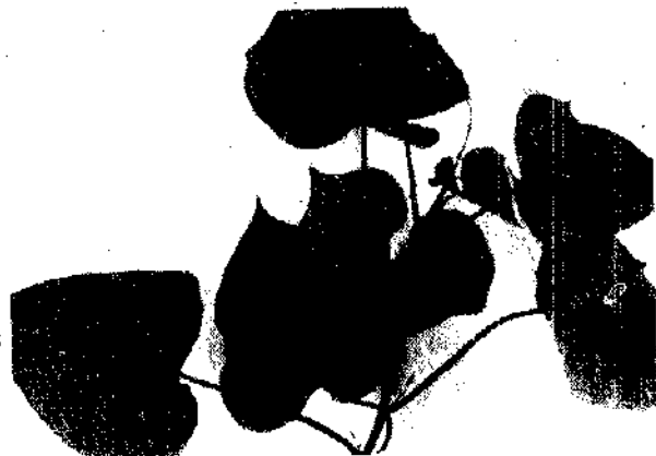
甘藷台農65號的葉形

雜糧基金會自62年開始，補助有關業者增建新型倉庫，至今已完竣各式雜糧倉庫80餘萬公噸。為明確各種型進谷倉的營運成本和利用效率，特撥款委請國立中興大學農產運銷系和糧食局，合作進行調查，以作為今後決定補助興建倉庫的類型，及採取經營規程與防霉設施等的依據。