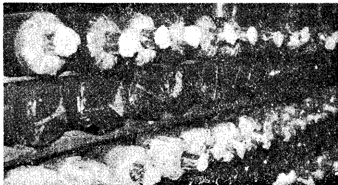
香菇太空包菌絲培養

本省一般香菇太空包，是在每年8月開始製作培養，至次年1月開始正式生產，採收至5月底結束