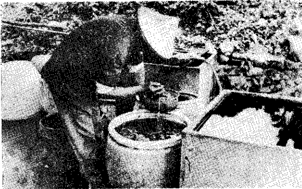
—— 咖啡水洗 ——

由果實製成咖啡豆方法，會影響將來咖啡的品質，一般製法有乾燥法和水洗法兩種。乾燥法是曬乾後