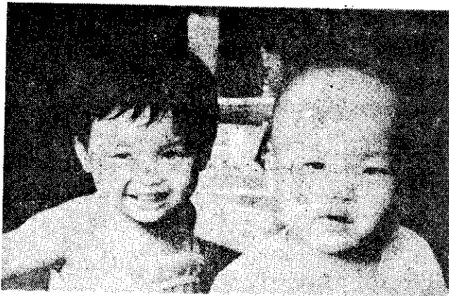
家庭計畫宜趁早，兩個孩子恰恰好