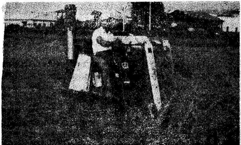
水稻聯合收穫機(蔡天來)