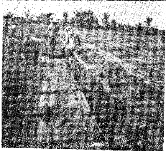
上：施放基肥 下：覆蓋塑膠布

作鳳梨產量僅及第一回收穫量之半，甚至低於一半以下（南投地區栽培法不同不在此論列）依據專家建議，台灣宿根鳳梨園每株施用氮肥8公克，鉀肥6公克，磷肥不施用。磷肥在土壤中分解緩慢，鳳梨植株對磷肥需要量亦較少，主作期所施用磷肥已足夠宿根作鳳梨植株吸收。