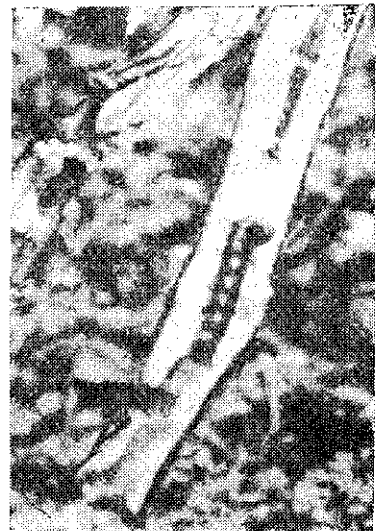
咖啡木蠹蛾蛀食髓部

為害情形：此蟲生活習性和台灣黃毒蛾類似，年發生8~9代，6~7月間最多，幼蟲取食葉片、