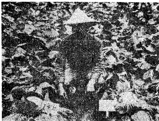
泰平村高冷地甘藍

央加速建設計畫，即在台北市郊大屯山及陽明山腰的坡地，設置蔬菜專業區，如北投竹子湖，士林菁山、平等里，這些地方的高度為海拔350~750公尺，極適合生產夏季蔬菜。12年來的努力耕耘與改進，產銷已達到理想，可譽為坡地夏季蔬菜經營的楷模。