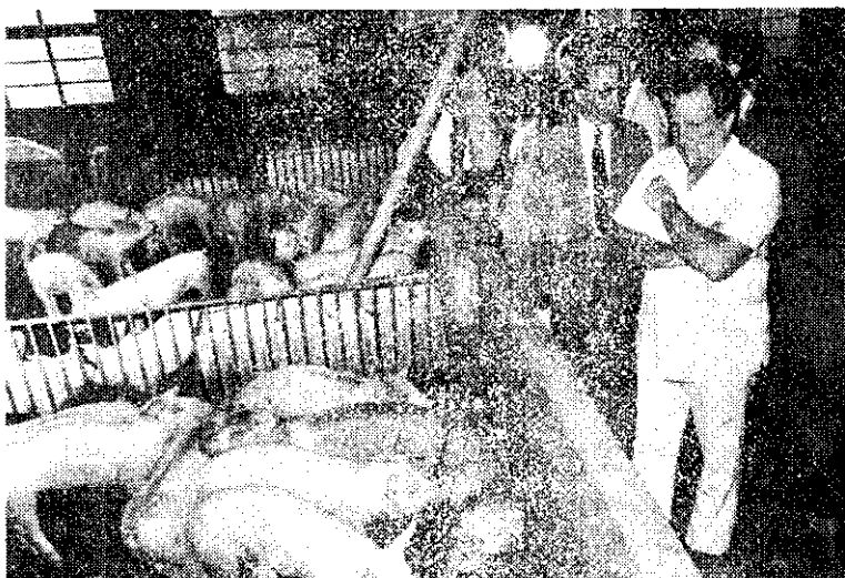
上：建國70年國慶國共大典中，陸軍「工蜂六式」56管聯裝火箭，接受蔣總統總閱國慶閱。