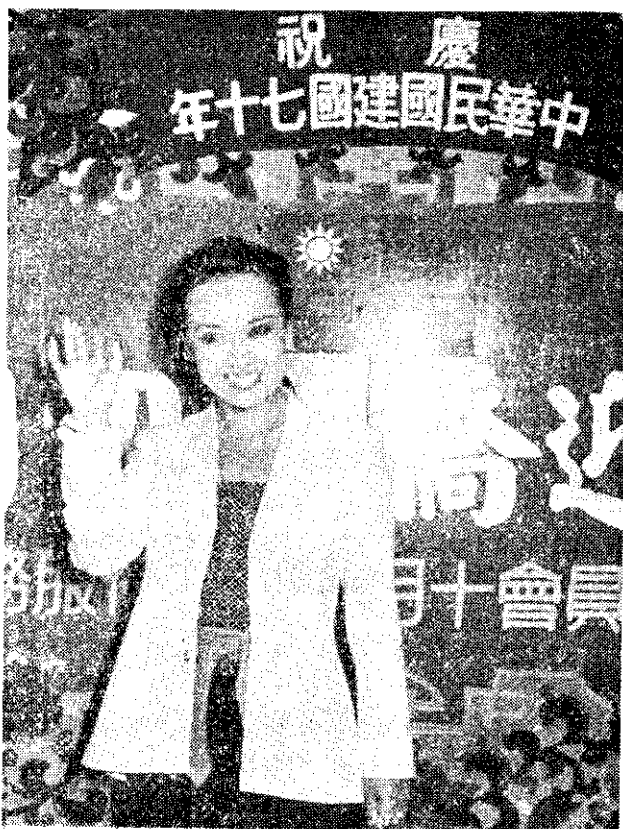
旅日影歌星翁倩玉，10月7日搭機返國，參加建國70年國慶慶典活動。