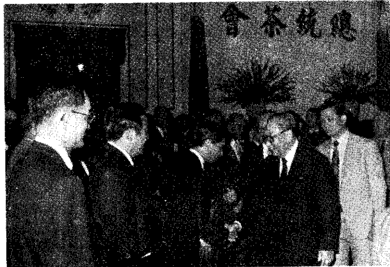
蔣總統經國於上月27日，在總統府大禮堂，以茶會接待出席我國70年僑務委員會議的海內外僑務委員108人。

補助標準為台灣地區每台水稻聯合收穫機售價的20%。小型循環式稻穀乾燥機每售價的10%。每台曳引機附屬農機補助售價的10%。每台太陽能乾燥機售價的20%。其他國產新型農機，每台最高補助