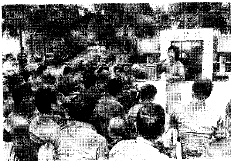
歌星鄧麗君，上月25日在全門前哨復與樂演唱勞軍，並與駐軍官兵同歌共舞，受到熱烈歡迎。

英國牛津郡農場1位67歲農友柯瑞爾，在19年前化了2個星期結合1個檢來的彩色舊瓶子，實際上是價值可達47,500美元的我國明代即公元1522~1566年間的瓷器，高35公分。最近經當地古物公司鑑定，將於本月9日拍賣，可使他發了一筆可觀的洋財。據說目前所知現存的這類瓶子只有6個。