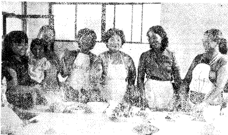
大寮鄉農會家政班員烹飪訓練