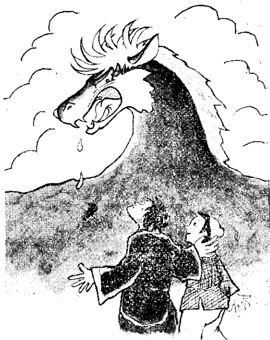
寡婦和兒子只好停住了腳步，靜待死亡的降臨。

兒子點了點頭，迅隨着母親往前行，狼魔十分好奇，尾隨在後，要看個明白。寡婦帶著兒子又來到墓前，有焚燒過的冥紙灰，寡婦抓了一把又塗抹到兒子的臉上，接著要兒子用