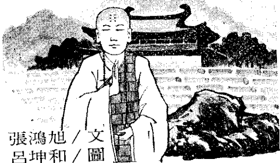
張鴻旭 / 文 呂坤和 / 圖

希遷是唐朝時候一位高僧，天寶年間，他居住在衡山南寺，寺東有一塊巨大的石頭，和希遷有著十分密切的關係，所以世人又稱他為石頭和尚。相傳那塊巨大的石頭，原是一匹狼魔，據地為王，到處危害生靈，無惡不作，使百姓們終日心驚膽顫，坐臥不安。