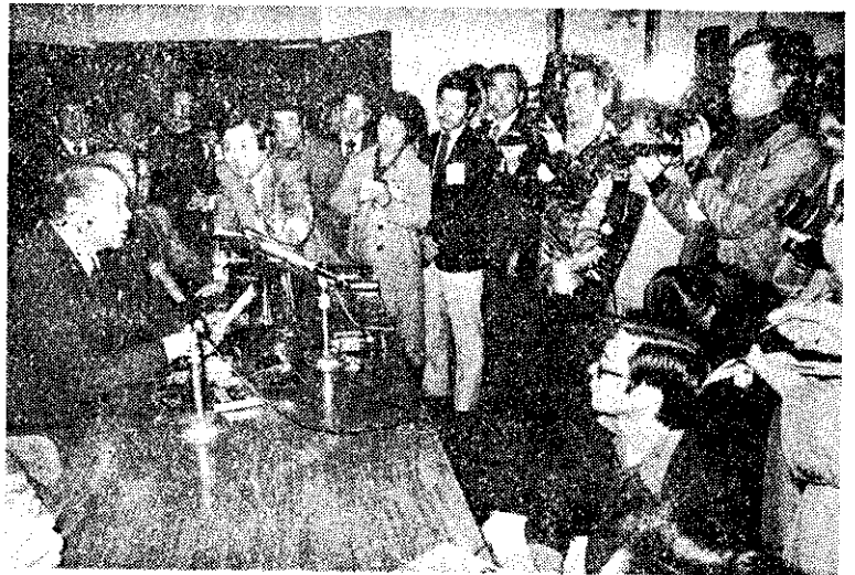
行政院長孫運璿(左)，上月11日結束在印尼5天的訪問後搭乘專機返抵台北，並在機場舉行記者會。

據悉會談內容有關農業方面的是我國將增派專家，協助印尼使其玉米和黃豆產量自給自足且能外銷；另則提供援助印尼增加漁船的計