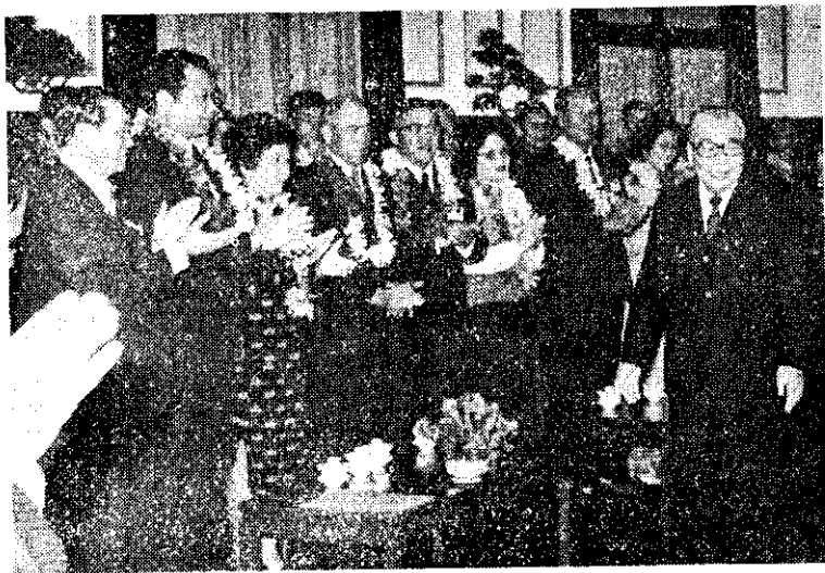
蔣總統經國於上月11日下午在總統府大禮堂，約見好人好事代表。