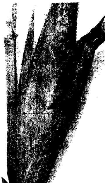
▲ 玉米蚜虫群集於穗上