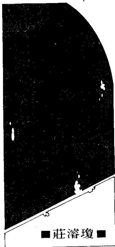
■ 莊濬瓊 ■