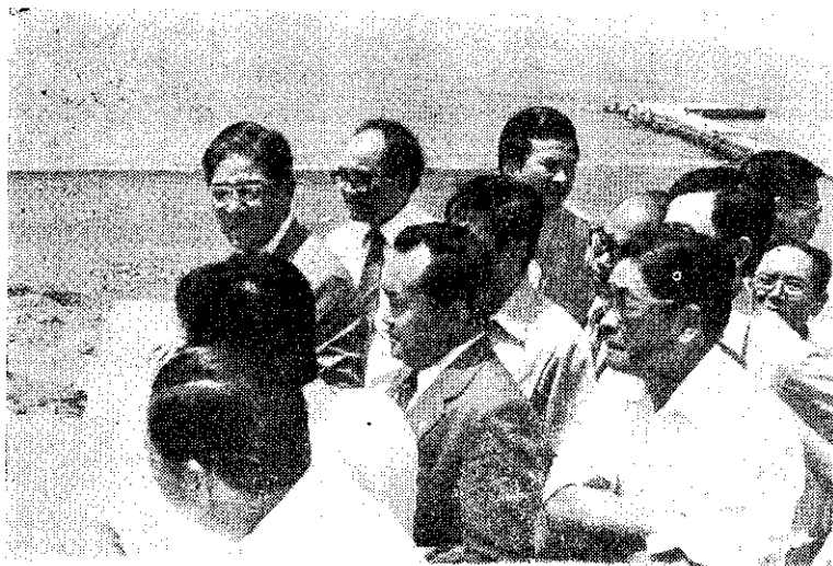
省主席李登輝巡視東港水產試驗所及枋寮沿海漁村。

李嫌供稱，作案所用手槍已丟到河裡，並在其家中起出贓款130萬元，搜到假髮及一把土製手槍，兩個空彈壳。