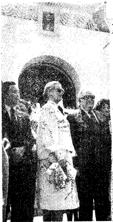
雷尼爾親王及王妃參觀中正紀念堂

本省全年宰雞10,500萬隻，進口15萬隻約佔全年的1/700，只合全省半天的宰雞量，因此影響很小。請養雞戶不必驚慌，勿因外界錯誤報導而提早出售。雞肉市場若超過實際需要1%，價格就會下降10%，反而對養雞戶不利。