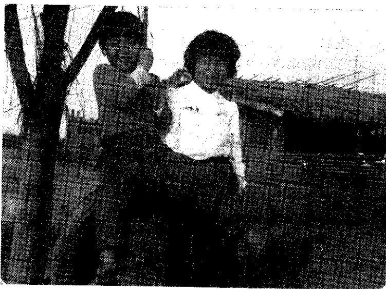
一對多麼活潑健康的孩子！（利玉芳）