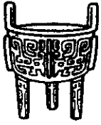
第一屆優良雜誌 金鼎獎