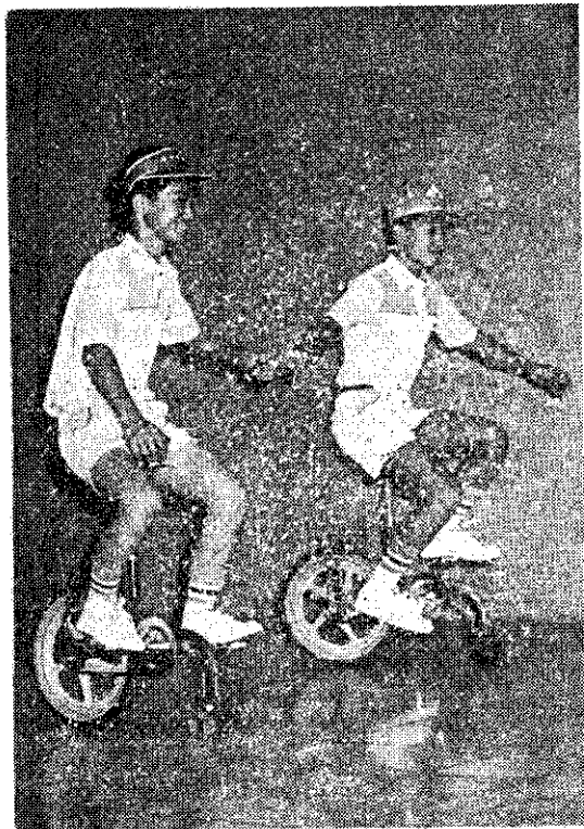
台北外貿協會展出的新型無把手三輪腳踏車