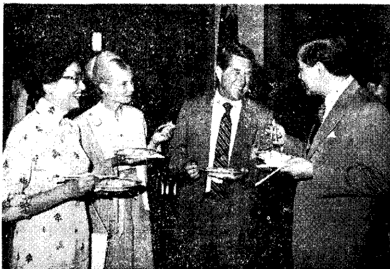
行政院長孫運璿夫婦，在歡迎支援抗奴役國家大會的茶會上，與美國眾議員索羅門夫婦交談。

令一架中共班機駕駛員，把飛機開到台灣，而其中一人在他的同伴勸飛航人員及乘客制服時，曾引爆一枚爆炸物。