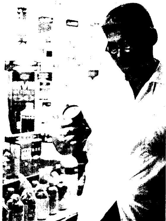
購買經政府檢驗合格的農藥

2. 對販賣業者的處罰——明知為偽農藥而販賣，或販賣而陳列儲藏，或為之分裝者，處2年以下有期